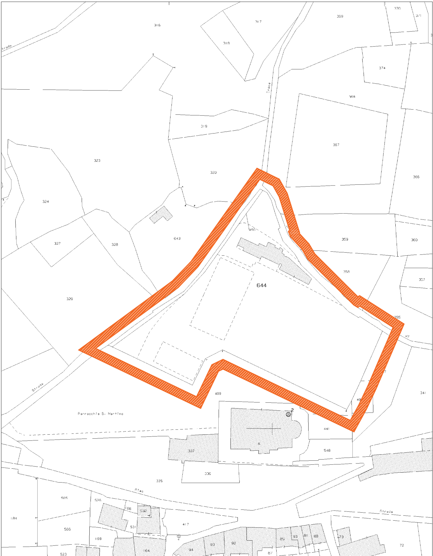
Estratto catastale Comune di Val di Chy Sezione A - Foglio 14 - Particella 644 scala 1:1.000